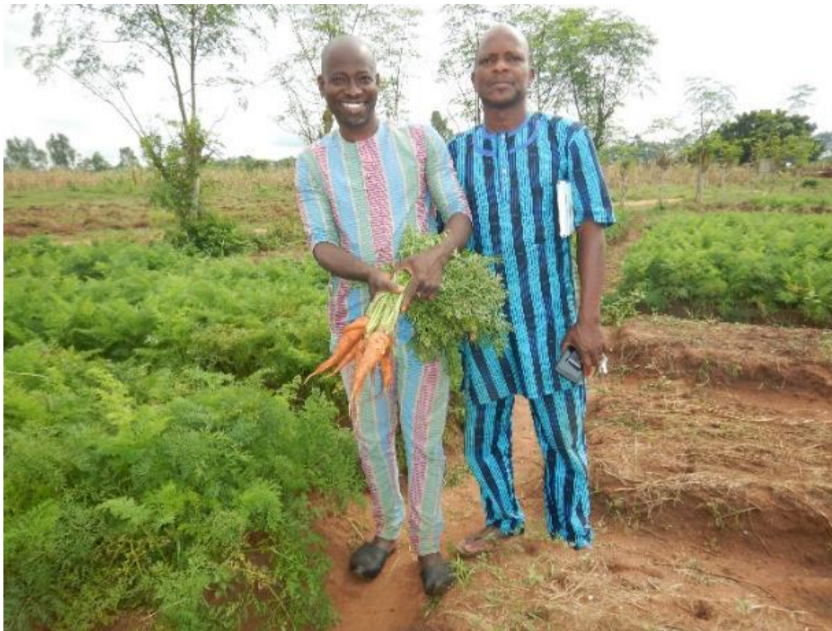
Carotte produits sous paillis de graminée