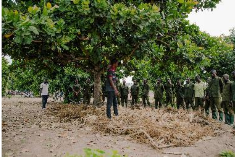
Démonstration demi-lune avec les lycéens à Kpataba