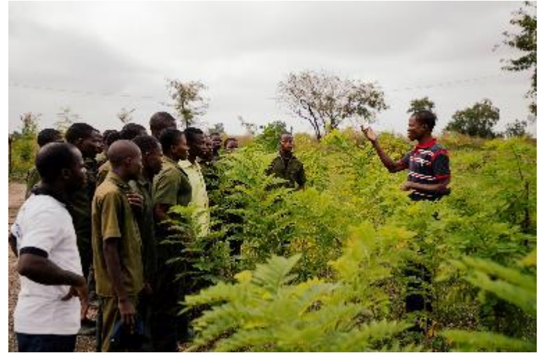
Lycéens sur une parcelle de Gliricidia (LTA de Kpataba)